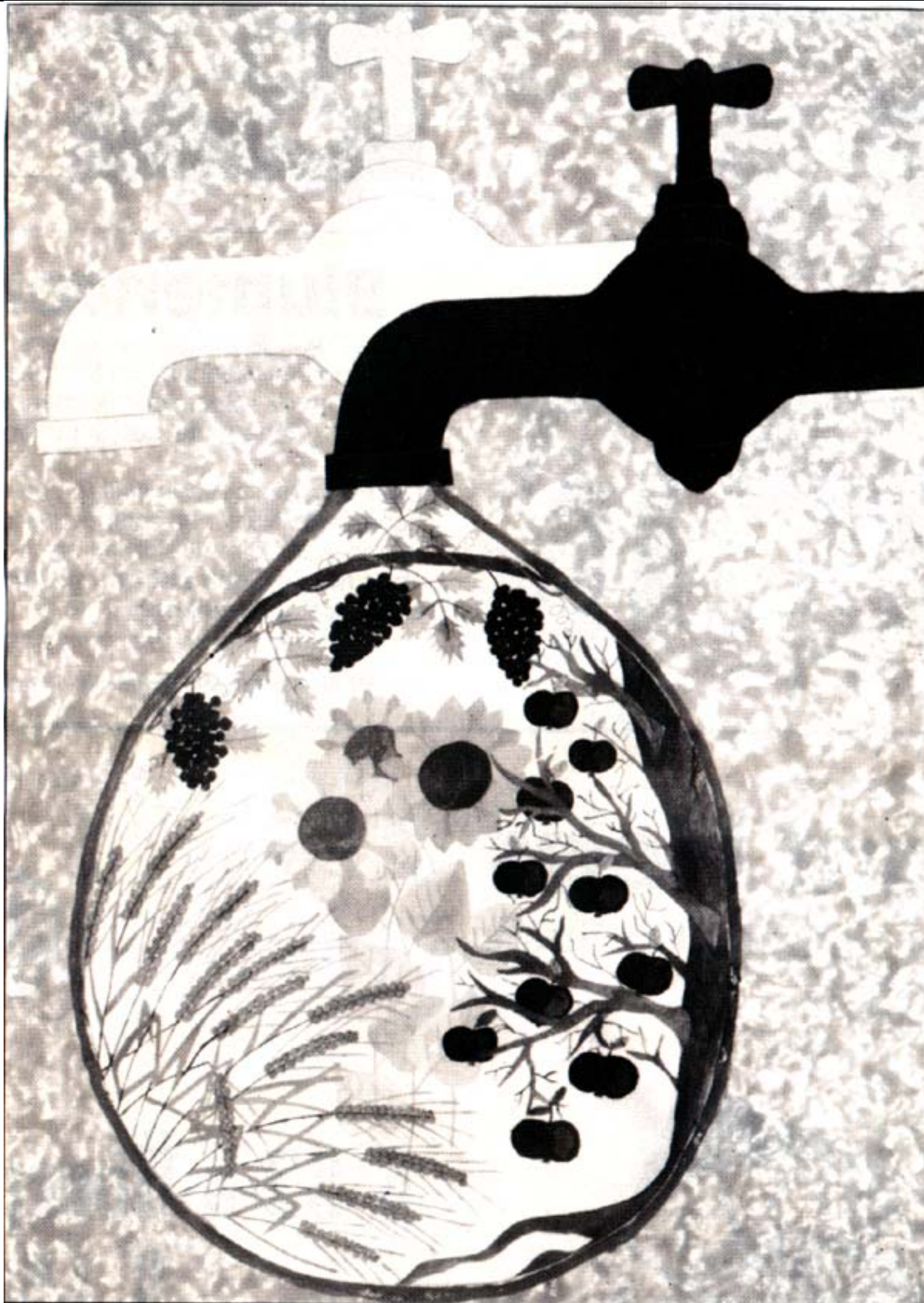
SIMONE KRUG aus Neuleutasch, 13 Jahre malte Ihre Vorstellung zum Thema "WASSER IST LEBEN"